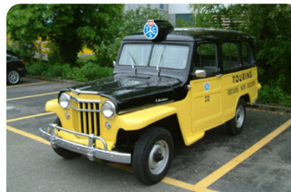
Willys Jeep – Int. 890