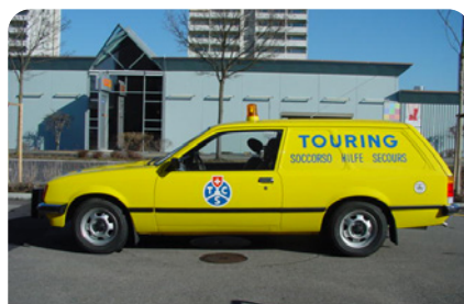
Opel Rekord – Int. 891