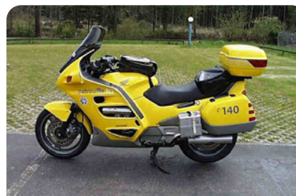
Honda Pan European – Int. 898