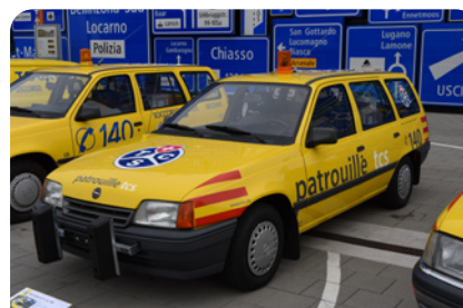
Opel Kadett E – Int. 892