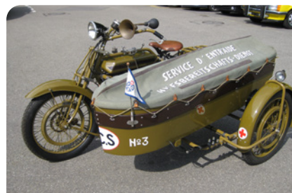
Motosacoche – Int. 896