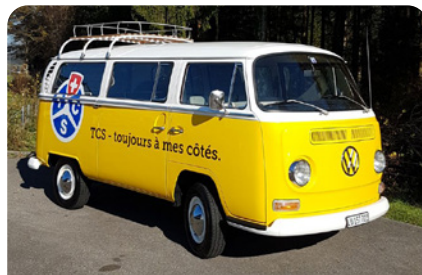
VW Bus T2 – Int. 990

Via Connect sur https://tcsgroup.odoo.com