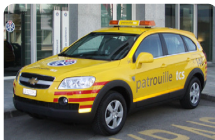
Chevrolet Captiva – Int. 021