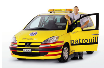
Peugeot 807 – Int. 361